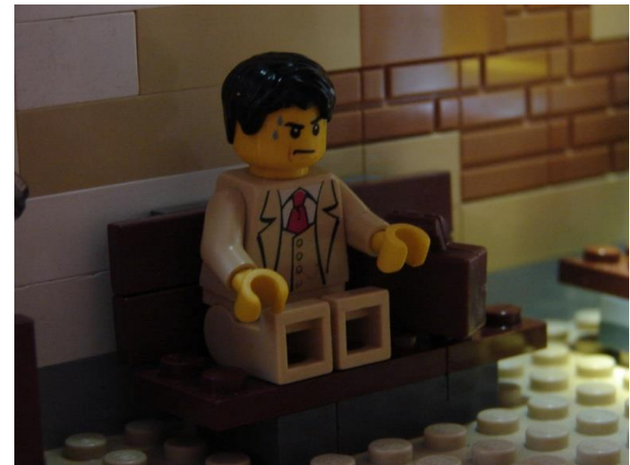
Kövércsöpek indultak homlokomról s végigcsurogtak gyűrött arcomon.