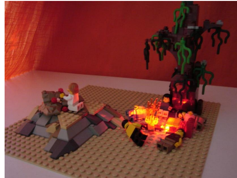
Péter aludt, János aludt, Jakab aludt, Máté aludt és mind aludtak...